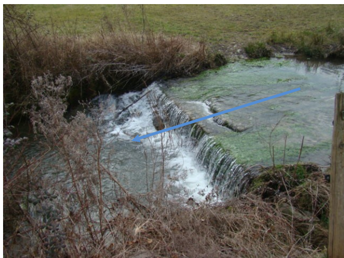
Avant travaux : Aval du gué