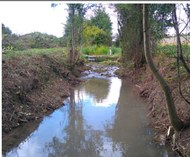
Avant Travaux :