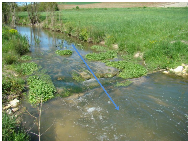
Après travaux : Aval du gué