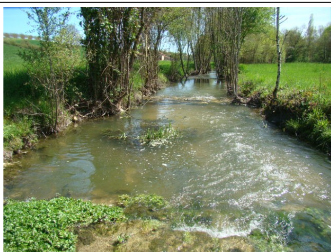
Après Travaux :