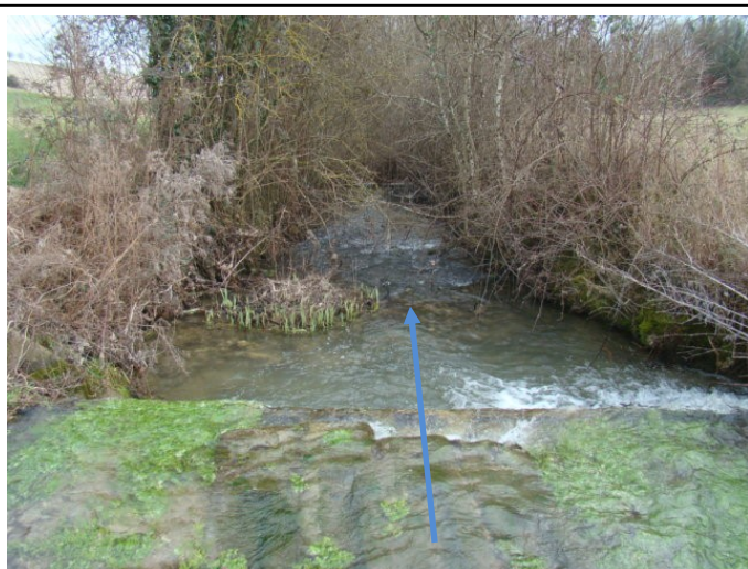
Avant Travaux :