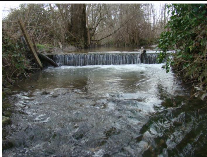
Avant travaux : Chute à l'aval