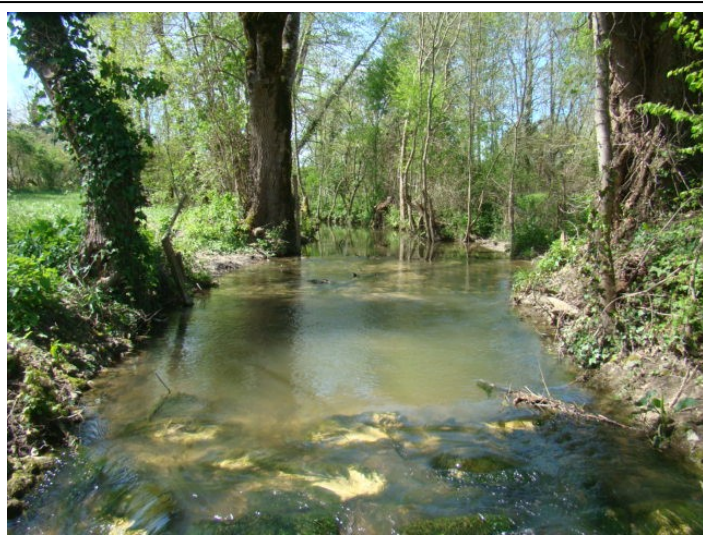
Après travaux : Aval du gué