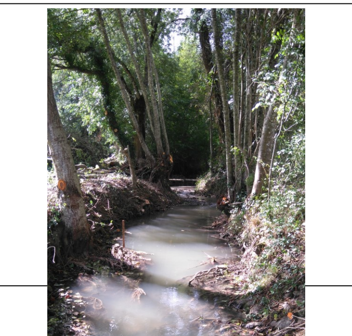
Avant travaux : En étiage aval du gué