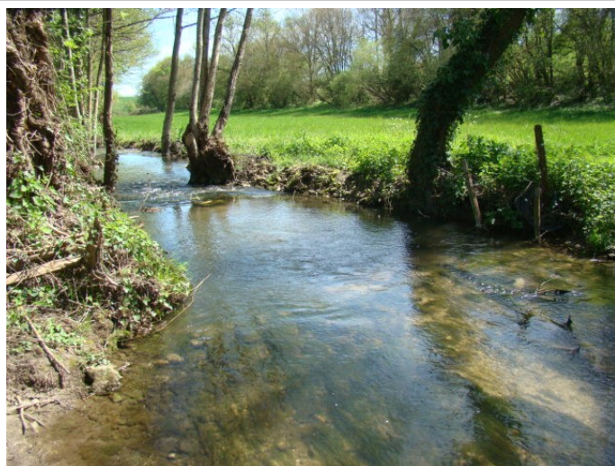
Après travaux : Aval du gué