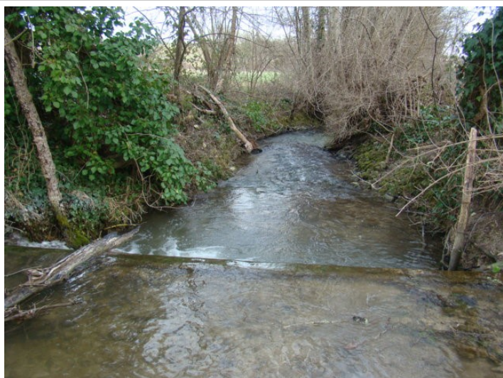
Avant travaux : Aval du gué