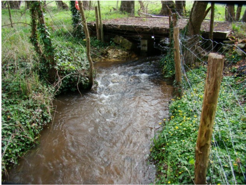
Après travaux : Aval du pont en basses eaux