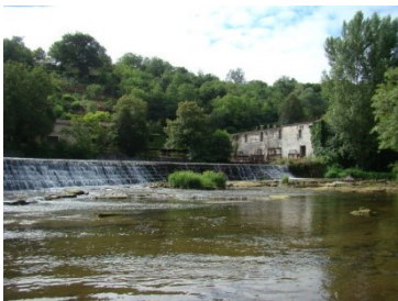
Seuils de Moulins