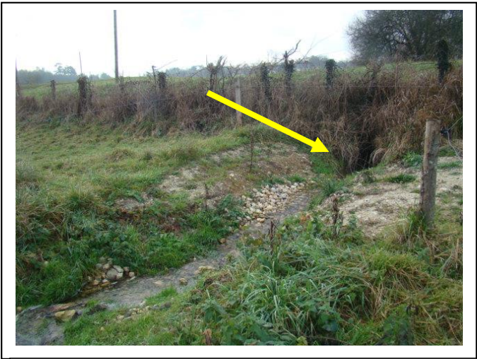
Après travaux entre le pont de la route communale et le pont agricole