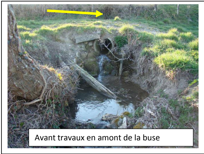
Avant travaux en amont de la buse