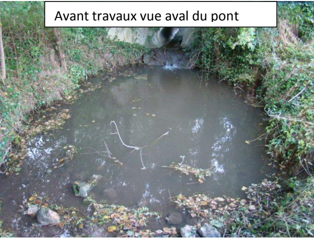
Avant travaux vue aval du pont