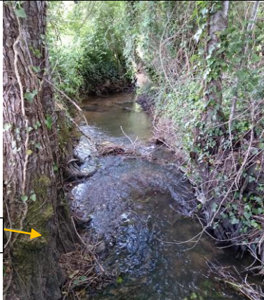
Vue de l'aval du pont avant travaux