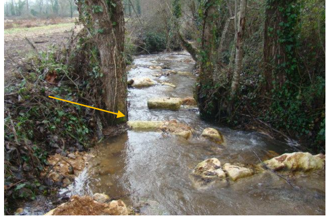
Vue de l'aval du pont après travaux