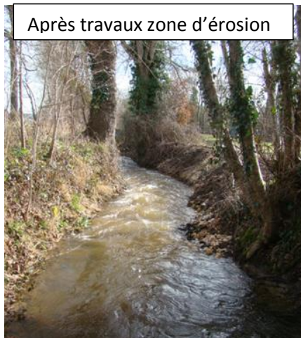
Après travaux zone d'érosion