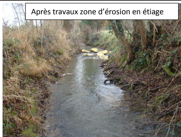
Après travaux zone d'érosion en étiage