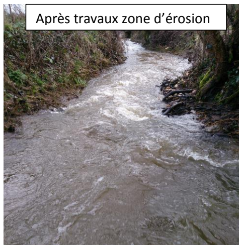
Après travaux zone d'érosion