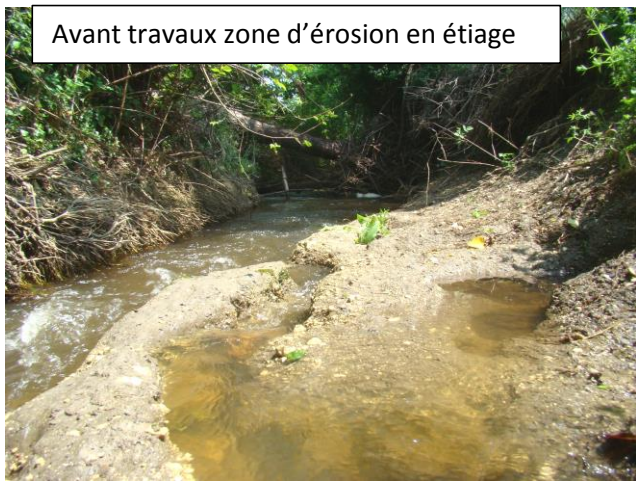
Avant travaux zone d'érosion en étiage