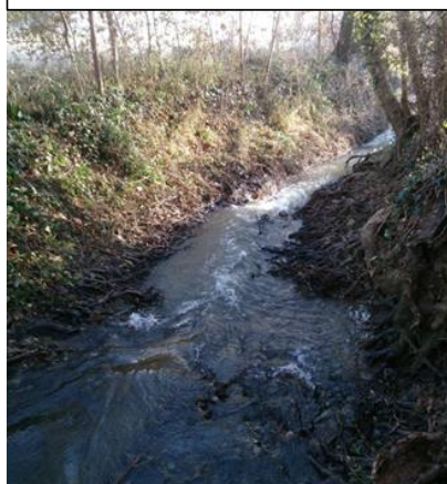
Avant travaux zone d'érosion