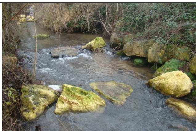
Après travaux en étiage vue par l'aval