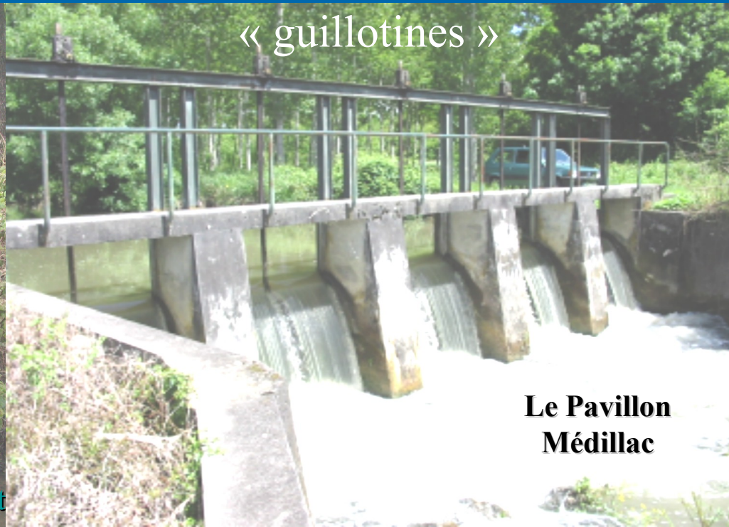
Le Pavillon Médillac