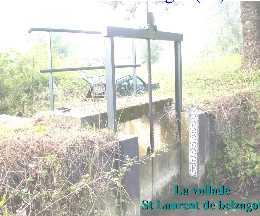
La vallade St Laurent de belzagot