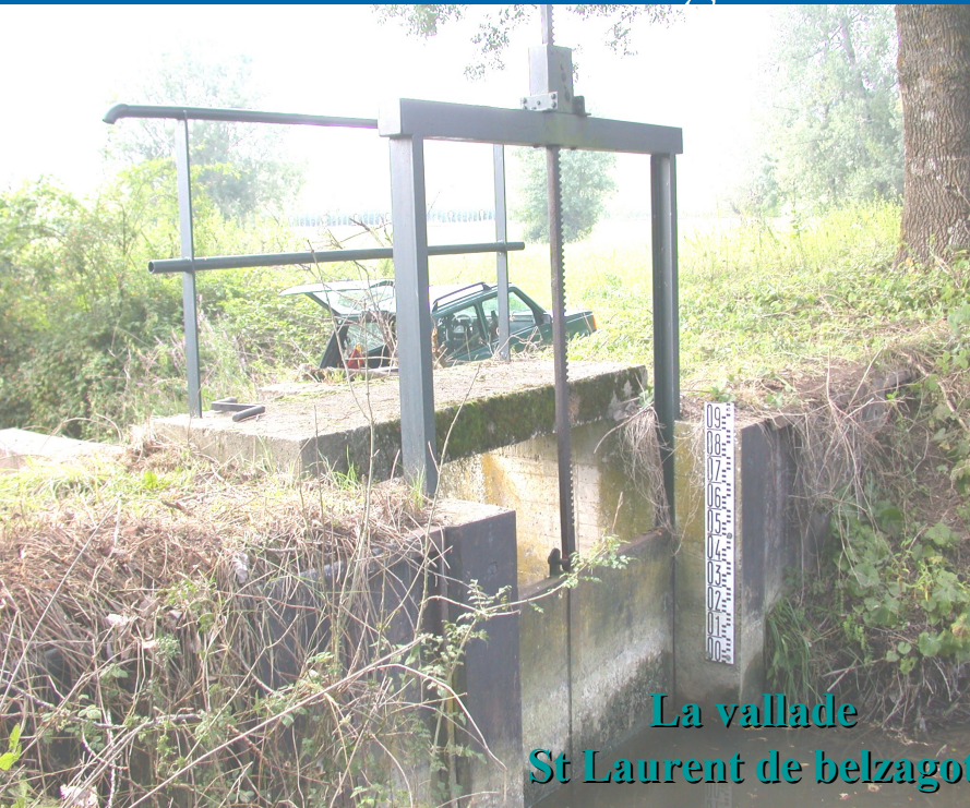
La vallade St Laurent de belzagot