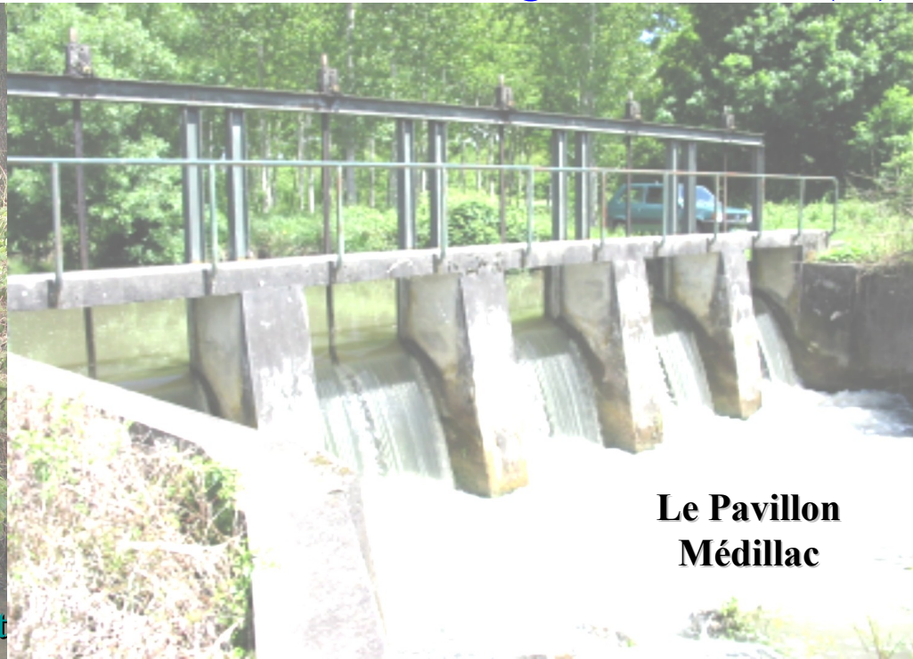
Le Pavillon Médillac