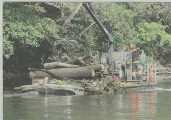
Les travaux concernent, d'amont en aval, Les Peintures, Chamadelle et Lagorce jusqu'à fin octobre.