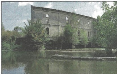
Site de Reyraud Aux Eglistottes.

L'entrepreneur doit respecter un cahier des charges précis prenant en compte plusieurs paramètres dont le respect des propriétés privées ainsi que le respect des prescriptions liées au milieu naturel (Natura 2000 Vallée de la Dronne). Une information a été faite au préalable, par courrier, à tous les riverains du secteur concerné, ainsi que des maires. La tranche actuelle des travaux concerne d'amont en aval, les communes des Peintures, de Chamadelle et de Lagorce, et se déroule jusqu'à fin octobre.